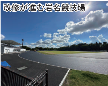
改修が進む岩名競技場