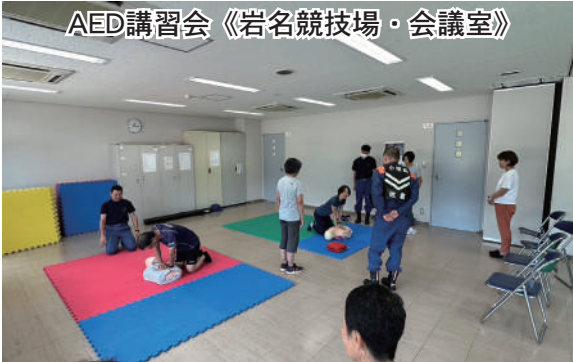
AED講習会《岩名競技場・会議室》