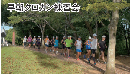
早朝クロカン練習会