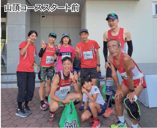
山頂コーススタート前

も残念ながら関門アウトだった方、残り数分の中でのフィニッシュなどお疲れさまでした。同日開催の「五合目コース」、それから、9月15日に行われた「第1回富士山ク