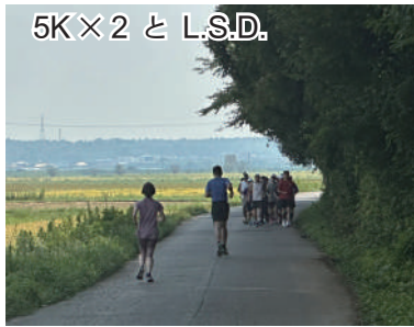
5K×2 と L.S.D.