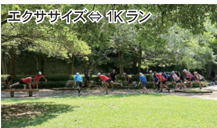
エクササイズ⇔1Kラン