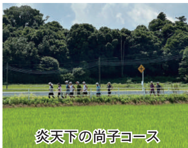
炎天下の尚子コース