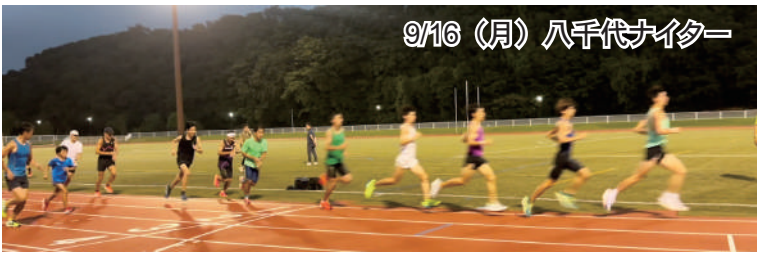
9/16(月) 八千代ナイター