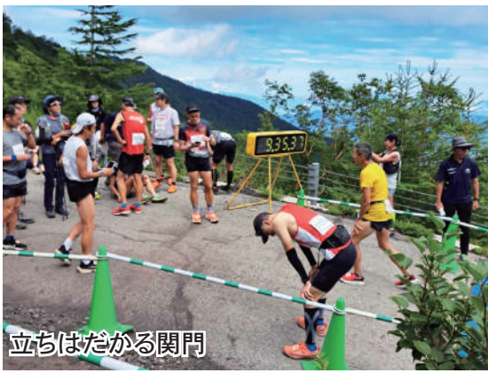
立ちほだかる関門