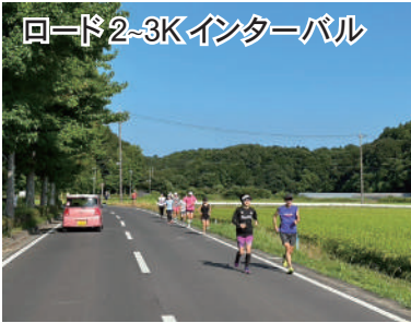
ロード2-3Kインターバル