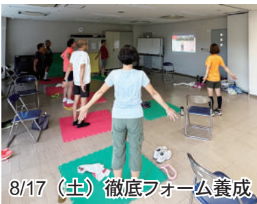
8/17(土) 徹底フォーム養成

7月27日(土) 練習会後、岩名まで佐倉消防の方々にお願いいただき、AED講習会を開講。コーチ・メンバー11名で手順・使用方法を学び、実習しました。