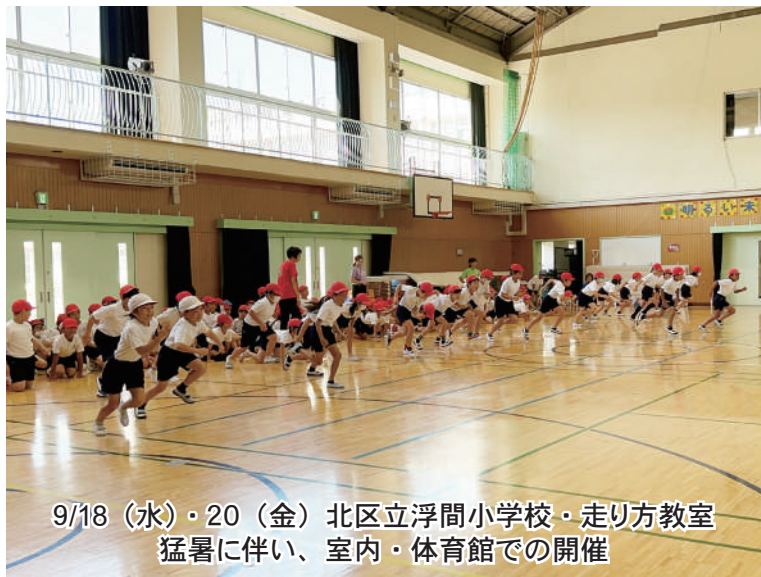
9/18(水)・20(金) 北区立浮間小学校・走り方教室 猛暑に伴い、室内・体育館での開催

北区立浮間小学校にて走り方教室が開催され、講師齊藤と関係者によるサポート3〜4名体制で教室を進行させていただきました。9月18日(水)1年・