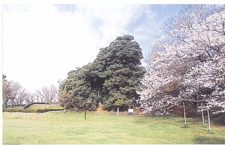
本丸跡 天守閣跡と夫婦モッコク