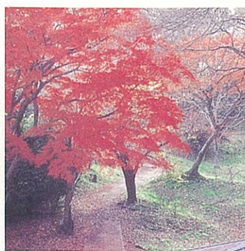
紅葉 (あずまや付近のイロハモミジ)