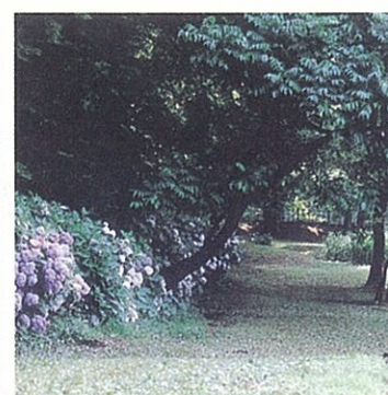
アジサイ (菖蒲園付近)