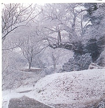
雪景色 (姥が池からあずまやへの園路)